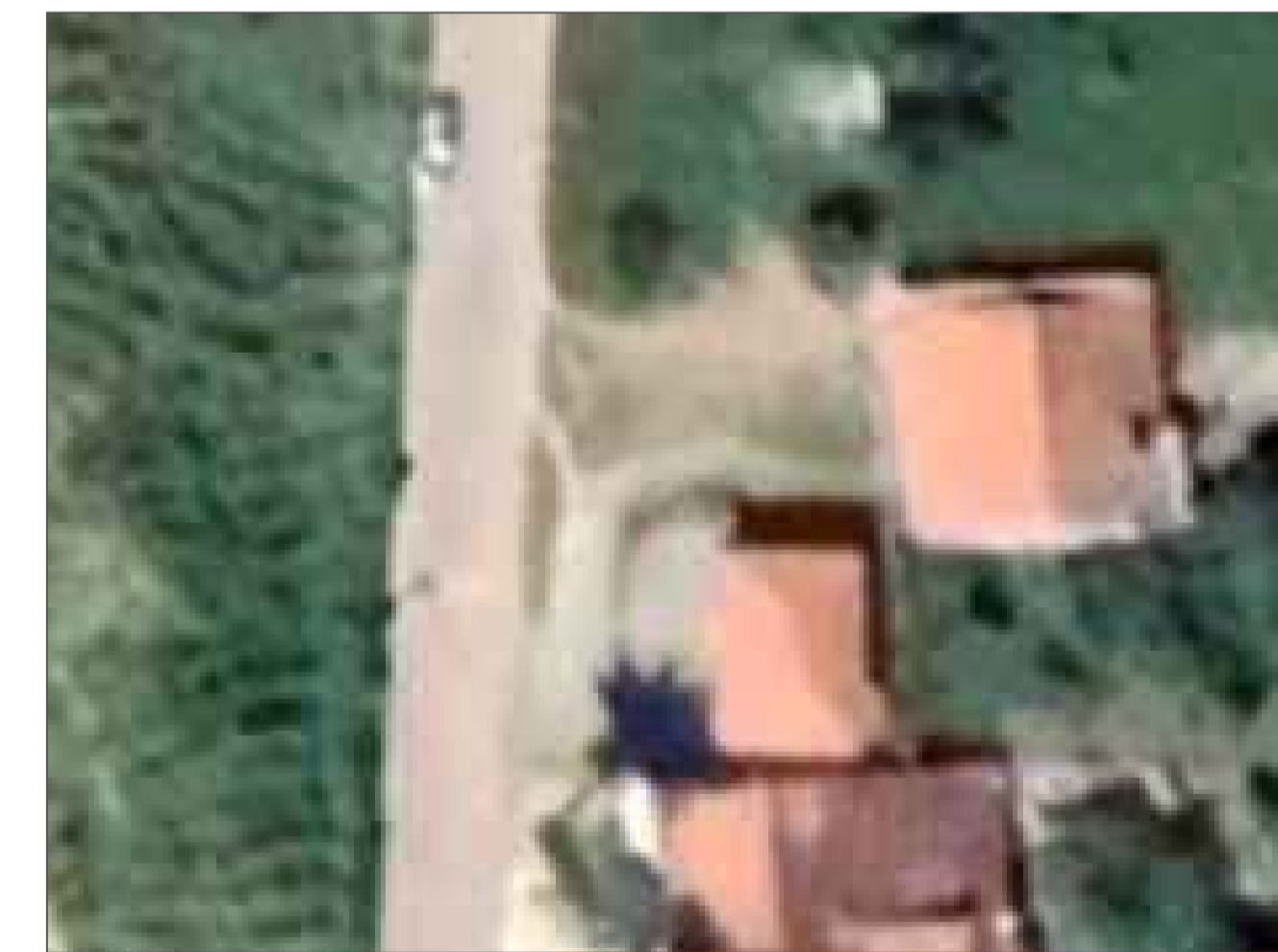
03 PLANTA DE SITUAÇÃO ESC. S/E