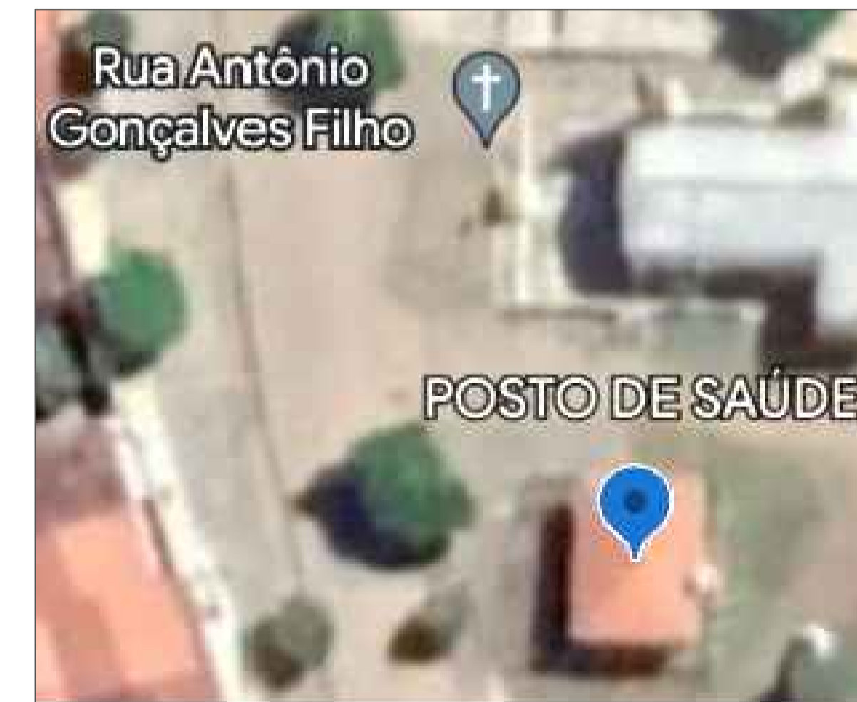
03 PLANTA DE SITUAÇÃO ESC. S/E