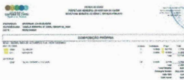
SC001 - COMPOSIÇÃO PRÓPRIA.jpg 107K

Santana do Cariri <licitasantana2021@gmail.com> Para: sec.obrassantana2022@gmail.com, obras@santanadocariri.ce.gov.br, obras obras <obras0459@gmail.com>