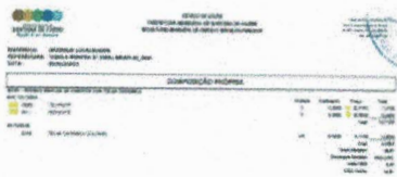
SC001 - COMPOSIÇÃO PRÓPRIA.jpg 107K