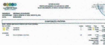
SC001 - COMPOSIÇÃO PRÓPRIA.jpg 107K