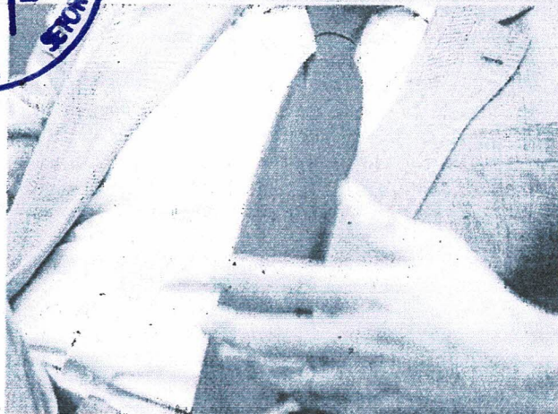
RICARDO MOURINHO, vice-presidente do Banco Europeu de Investimentos (BEI)

Mourinho pontua ainda que "o mais importante" é existirem projetos alinhados às prioridades de investimentos da União Europeia, como conectividade, energia e digital, mas também de educação e