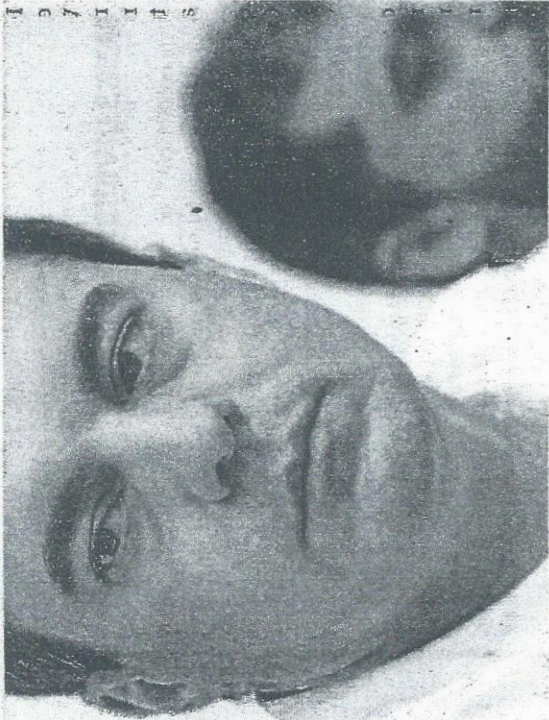
WAGNER tem enfatizado proposta de parceria e consultoria com ex-agente da polícia federal americana

A proposta é destaque nas inscrições que ele tem apresentado no eleitoral gratuito do rádio e da